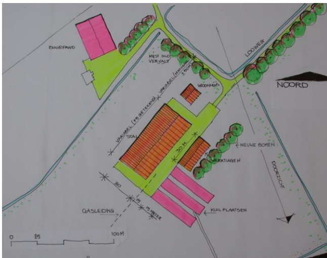
mogelijke opstelling van de gebouwen ( indelingschets) variant A