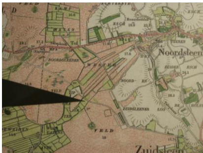
Historische kaart ± 1900

Bij alle nieuwe ruimtelijke ingrepen dient in een ruimtelijke onderbouwing behorende bij een bestemmingsplan of aanvraag omgevingsvergunning, waarbij gevraagd wordt af te wijken van het bestemmingsplan, ook aandacht besteed te worden aan archeologie en cultuurhistorie..